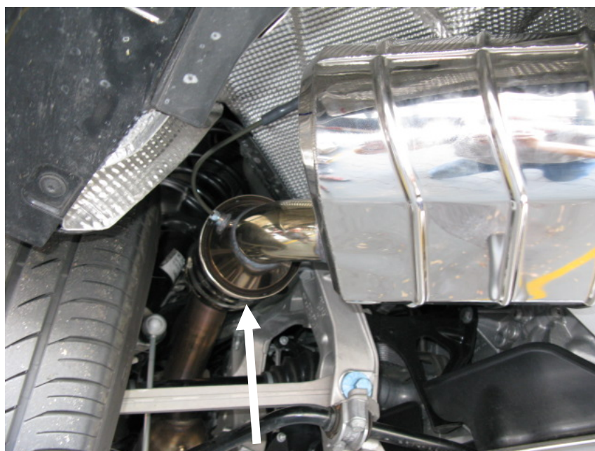
Katalysator, nicht für serienm. Euro 5 Fahrzeuge erforderlich / Catalytic converter, not for series Euro 5 vehicles necessary